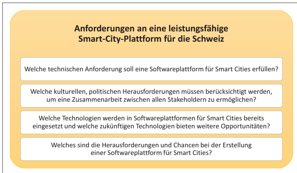
Abbildung 1 Forschungsfragen.

In der vorliegenden Studie wurden konkret folgende Forschungsfragen untersucht: